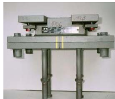
Elastomérløjets placering i fastholdekonstruktionen. Desuden ses transportskruerne (røde).