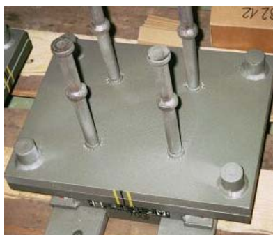
Ankre af påsvejste dybler fastholder lejets underpart.

Det viste leje er designet til montage med bolte under en stålbro, der hviler på betonsøjler. Lejet er forsynet med en mellemlade, der gør det muligt at udskifte både elastomérløjet og begge de kraftoverførende plader.