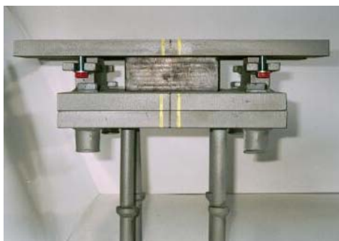
Knasternes position i styret.

Via kontakten mellem knasternes ender og overpladens kanter føres kræfter ned til underpladen. Kræfterne overføres på langs af pladen.